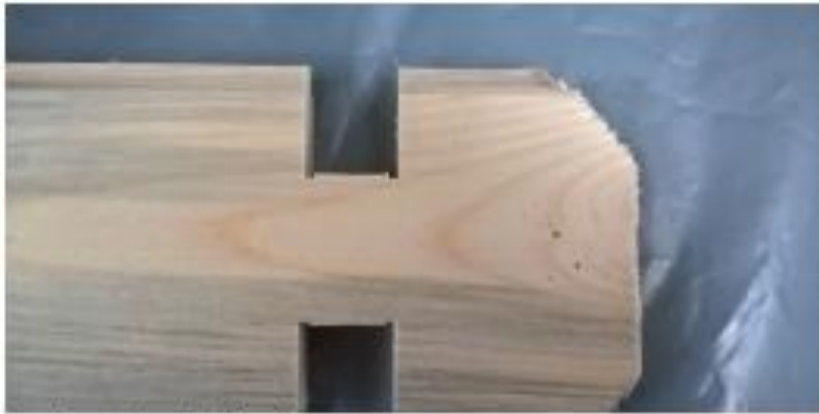
coloration du bois