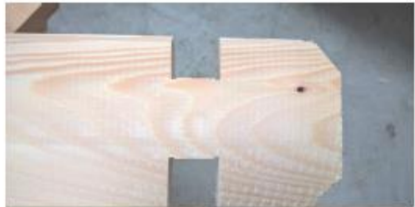
petits défauts d'usinage

Difetti analoghi a quelli sopra riportati ( colore del legno, impronte o macchie, gocce di resina, piccoli difetti di lavorazione ) sono accettabili.