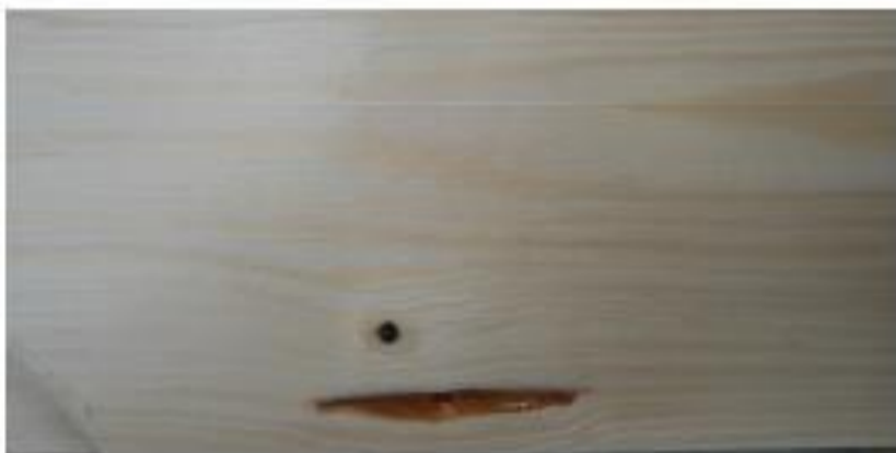
poche de résine